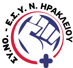
Σύλλογος Νοσηλευτών Ε.Σ.Υ. Ν. Ηρακλείου