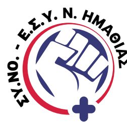
Σύλλογος Νοσηλευτών Ε.Σ.Υ. Ν. Ημαθίας