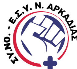
Σύλλογος Νοσηλευτών Ε.Σ.Υ. Ν. Αρκαδίας