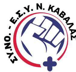
Σύλλογος Νοσηλευτών Ε.Σ.Υ. Ν. Καβάλας