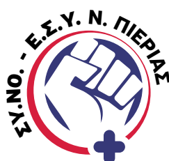
Σύλλογος Νοσηλευτών Ε.Σ.Υ. Ν. Πιερίας