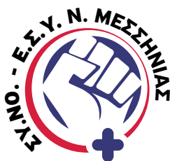
Σύλλογος Νοσηλευτών Ε.Σ.Υ. Ν. Μεσσηνίας