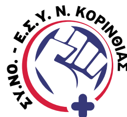
Σύλλογος Νοσηλευτών Ε.Σ.Υ. Ν. Κορινθίας