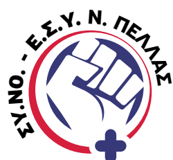
Σύλλογος Νοσηλευτών Ε.Σ.Υ. Ν. Πέλλας