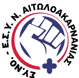
Σύλλογος Νοσηλευτών Ε.Σ.Υ. Ν. Αιτωλοακαρνανίας