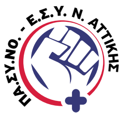
Πανελλήνιος Σύλλογος Νοσηλευτών Ε.Σ.Υ. Ν. Αττικής