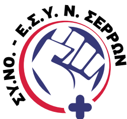
Σύλλογος Νοσηλευτών Ε.Σ.Υ. Ν. Σερρών