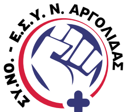
Σύλλογος Νοσηλευτών Ε.Σ.Υ. Ν. Αργολίδας