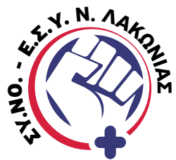
Σύλλογος Νοσηλευτών Ε.Σ.Υ. Ν. Λακωνίας