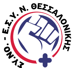
Σύλλογος Νοσηλευτών Ε.Σ.Υ. Ν. Θεσσαλονίκης