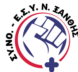
Σύλλογος Νοσηλευτών Ε.Σ.Υ. Ν. Ξάνθης