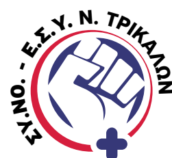
Σύλλογος Νοσηλευτών Ε.Σ.Υ. Ν. Τρικάλων