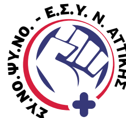
Σύλλογος Νοσηλευτών Ψυχιατρικών Νοσοκομείων Ε.Σ.Υ. Ν. Αττικής