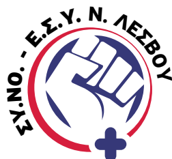
Σύλλογος Νοσηλευτών Ε.Σ.Υ. Ν. Λέσβου