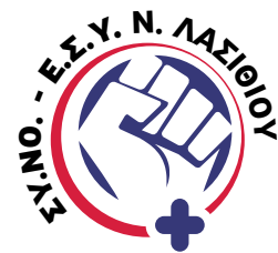
Σύλλογος Νοσηλευτών Ε.Σ.Υ. Ν. Λασιθίου