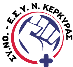
Σύλλογος Νοσηλευτών Ε.Σ.Υ. Ν. Κέρκυρας