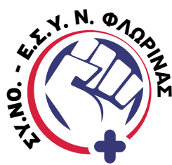
Σύλλογος Νοσηλευτών Ε.Σ.Υ. Ν. Φλώρινας