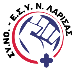
Σύλλογος Νοσηλευτών Ε.Σ.Υ. Ν. Λάρισας