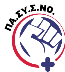
Πανελλήνιος Σύλλογος Σχολικών Νοσηλευτών