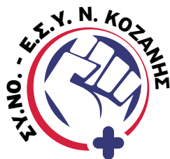
Σύλλογος Νοσηλευτών Ε.Σ.Υ. Ν. Κοζάνης